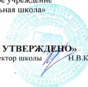
График питания обучающихся в школьной столовой на 2022-2023 учебный год

Количество посадочных мест в столовой- 100 мест